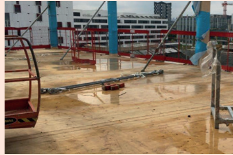
Bauschaden durch Feuchtigkeit

Ausfallzeiten durch Regen? Nicht mehr mit dem Feuchteschutz Wetguard 200 SA. Mit Wetguard sind Holzelemente vor Feuchtigkeit geschützt und bleiben bei jedem Wetter trocken.